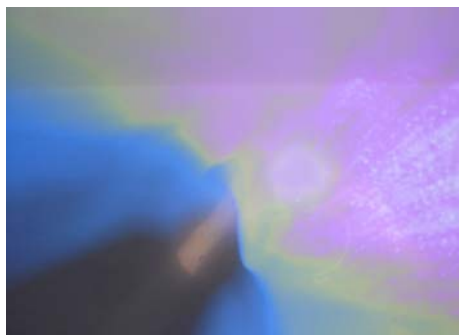
Philip Glass/Foday Musa Suso „Warda's Whorehouse“

Oft gehört und dann, an der „richtigen“ Stelle auf „Stopp“ gedrückt, wenn sich meine Vorstellung mit der des Computerbildes ungefähr deckte. So entstand das Computerfoto, das sozusagen als Ausgangspunkt für die Malerei diente. Die Computerfotos stehen autonom der Malerei gegenüber.