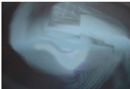
Morton Feldmann „Something Wild“